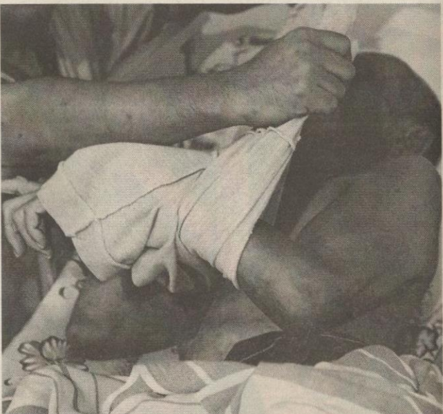
TERBUANG...seorang warga emas berusia 70 tahun diserang angin ahmar yang dihantar anak kandungnya ke Pusat Jagaan Nur Ehsan, Kempas.

"Berikutan itu, kami perlu memikul tanggungjawab menjaga, malah menguruskan pengebumian warga